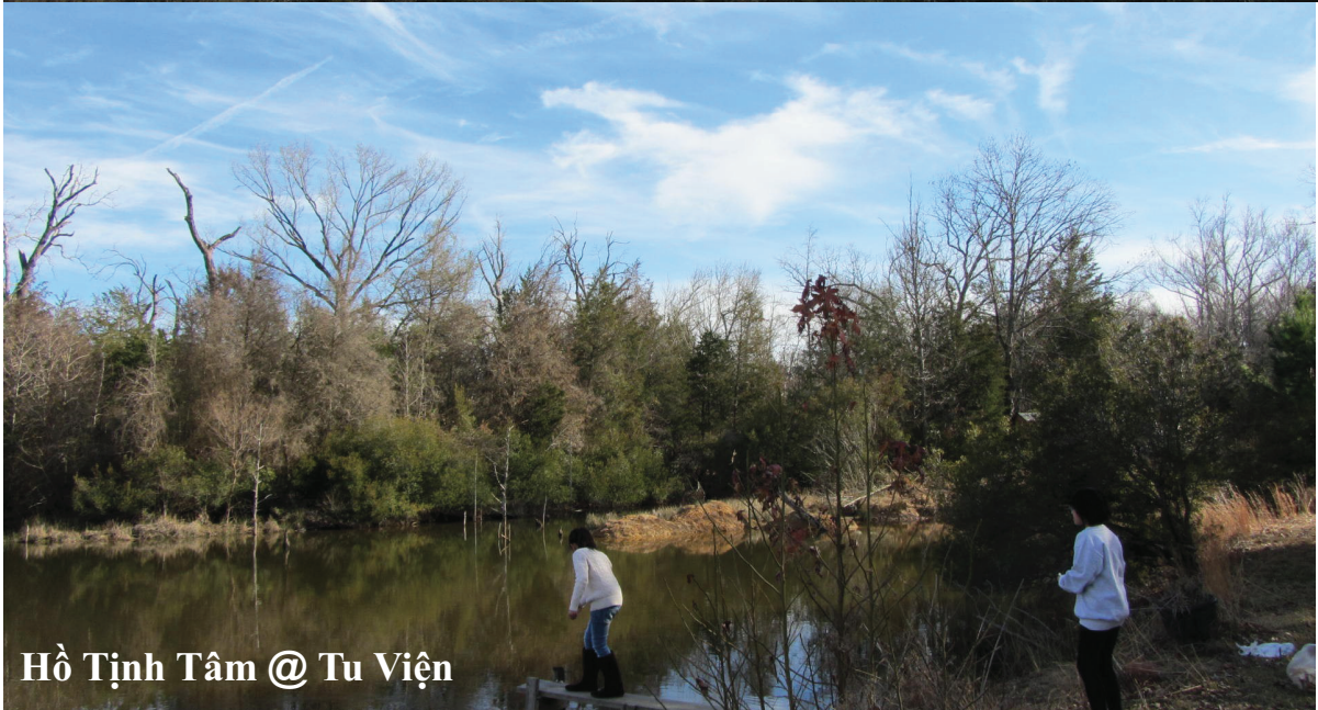
Hồ Tịnh Tâm @ Tu Viện