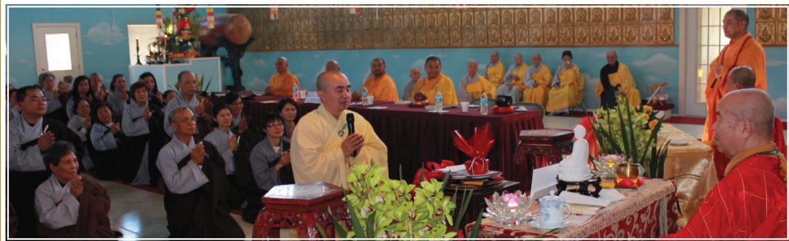
Hòa Thượng Tăng Thống trùng tuyên Giáo Chỉ Tấn Phong Thầy Viện Trưởng lên hàng giáo phẩm Thượng Tọa để Tăng Ni Phật tử tứ phương tường tri.

Để quảng độ cho người phát tâm cần cầu thọ giới, Hòa Thượng Tăng Thống vì giới tử khai đàn làm Giới Sư truyền giới cho Lễ Đàn Thức Xoa Ma Na Ni, SaDi, SaDiNi, và Lễ Đàn Bồ Tát Giới cho chư vị xuất gia cũng như tại gia cư sĩ.