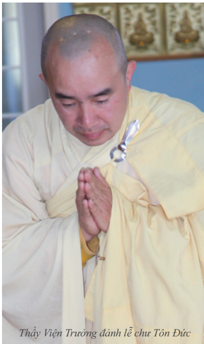
Thầy Viện Trưởng dâng lễ chư Tôn Đức