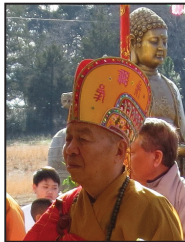
Đức Đệ Nhị Tăng Thống Giáo Hội Phật Giáo Linh Sơn Thế Giới Hòa Thượng thượng Tịnh hạ Hạnh