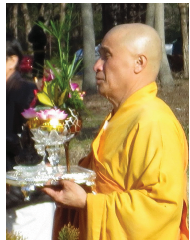
Thầy Trụ Trì Tu Viện ADiĐà