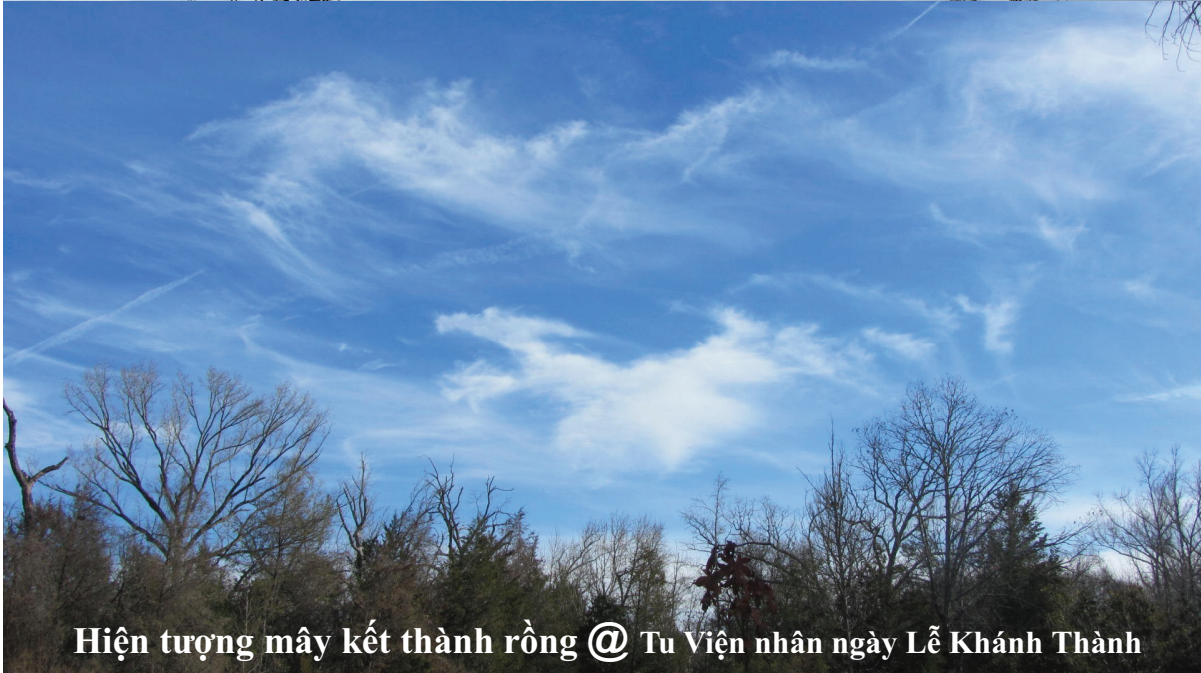
Hiện tượng mây kết thành rồng @ Tu Viện nhân ngày Lễ Khánh Thành