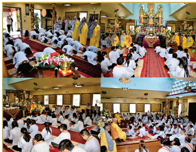
Quang cảnh trong Đại hùng bửu điện

Và sau pháp trì bình nhất thực, Đại Lễ đã được cử hành trọng thể. Chương trình Đại Lễ đã được lồng thêm tiết mục mừng Đệ Nhất Chu Niên thành lập Lớp Việt Ngữ. Các em rất ngoan ngoãn, lắng nghe Thầy Viện Trưởng dành thời pháp đặc biệt cho các em.