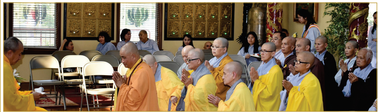
• Pháp Phật dạy Hiếu là tối thượng, Bậc xuất gia trì bất khả khinh •