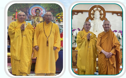
KHÁNH TUẾ HT TỪ ĐÀM, HT LIÊN HOA | 2021