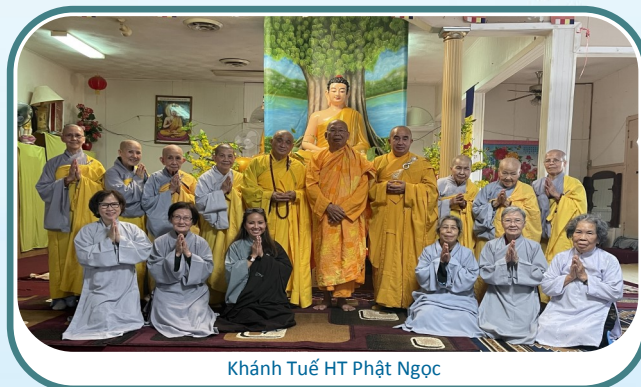
Khánh Tuế HT Phật Ngọc