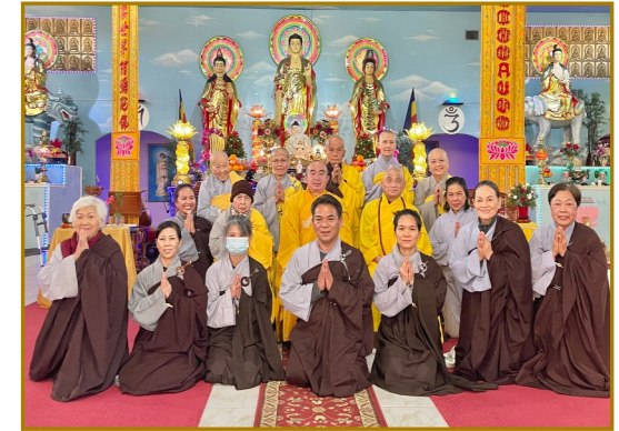
Sự lợi ích của Giới Bồ Tát - Giới Bồ Tát sẽ theo giới tử cho đến khi giới tử thành Phật