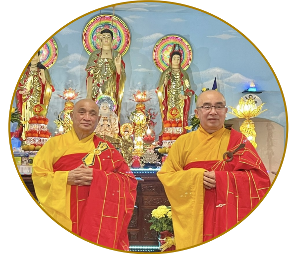
Tết Quý Mão - 2023 tại Linh Sơn ADiĐà Viện