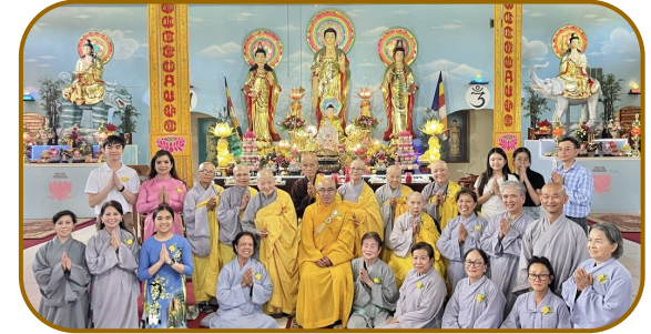
Lễ Vu Lan - 2023 tại Linh Sơn ADiĐa Viện