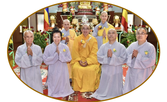
Ban Trì Sự tại Linh Sơn Ohio | 2023

Người ngu biết mình ngu, Nhờ vậy thành có trí, Người ngu cho mình trí, Thật đáng gọi chí ngu!