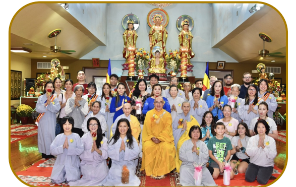
Lễ Vu Lan - 2023 tại Linh Sơn Ohio