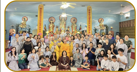
Lễ Phật Đản - 2023 tại Linh Sơn ADiĐà Viện