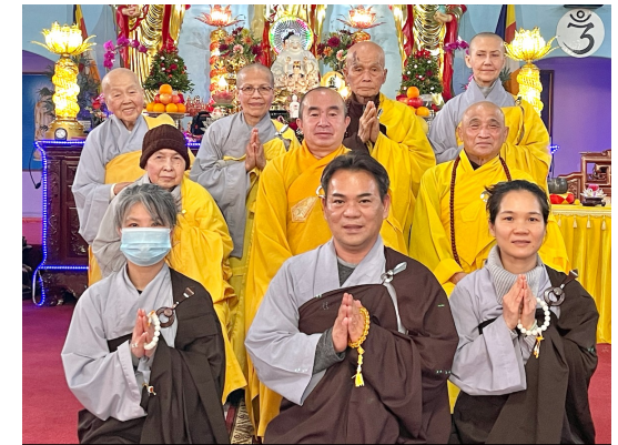
Tân Bồ Tát Gii Tử : Viên Bảo, Viên Thiện, Viên Bạch

Dù sống đến trăm năm, Không thấy Pháp bất diệt, Chẳng bằng sống một ngày, Thấy được Pháp bất diệt. Though one should live a hundred years without wisdom and control, yet better, indeed, is a single day's life of one who is wise and meditative. Kinh Pháp Cú 6 - Phẩm Muôn Ngàn