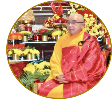
Tết Quý Mão - 2023 tại Linh Sơn Ohio