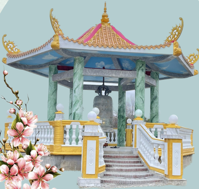
Linh Sơn ADiĐà Viện Quitman, Texas